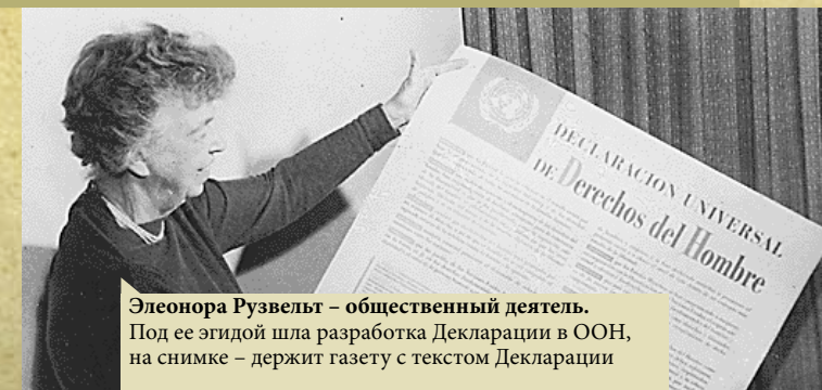
Элеонора Рузвельт – общественный деятель. Под ее эгидой шла разработка Декларации в ООН, на снимке – держит газету с текстом Декларации

Все люди рождаются свободными и равными в своем достоинстве и правах (ст. 1 Декларации)