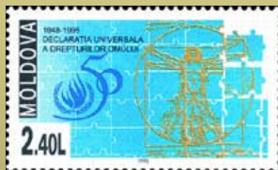
Почтовая марка Молдовы к 50-летию Декларации

Всеобщая Декларация Прав Человека – уникальный документ, принятый в 1948 году. Над её созданием работали специалисты из Австралии, Канады, Китая, Ливана, СССР, США, Франции и других стран. Декларация стала первым глобальным документом, провозгласившим ценности жизни, свободы, равенства. Они вошли в основу международного права.